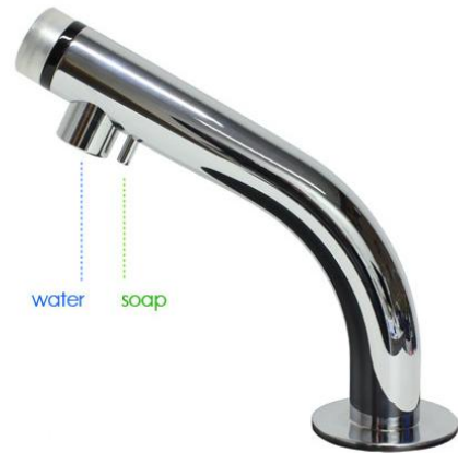
Miscea Light 2 i 1 – til forblandet vand