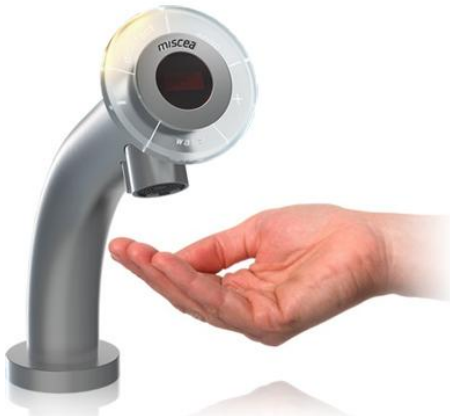
Miscea Classic 3 i 1 – vand, sæbe & desinfektion

Dårlig håndhygiejne udgør et stadig større problem i stor set alle aspekter af vores dagligdag. Miscea Classic® og Miscea Light® med den nyeste infrarøde teknologi gør det nu muligt at få vand, sæbe og desinfektionsmiddel helt uden at røre ved armaturet, det reducerer risikoen for krydskontaminering og sikrer en høj hygiejnestandard.